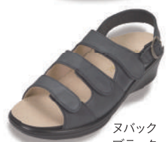
ヌバック ブラック