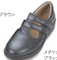
メタリック ブラック