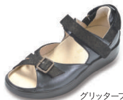
グリッターブラック