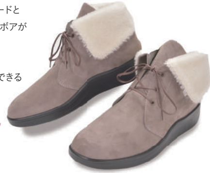
スウェードグレー

エレガントなイタリアンスエードと ジャーマンアルパカウールのボアが 暖かく足を包みます。 「耳」を立てる事で ショートブーツとしても利用できる 贅沢な1足です。